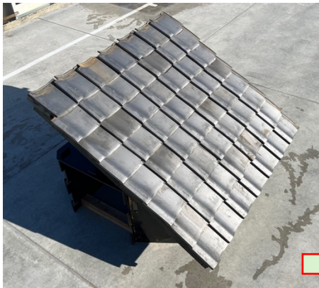
① 組み立て完了の状態