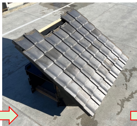
② 進入部分の瓦を離脱 ※ビス又は釘を1枚ずつ抜く必要がある。