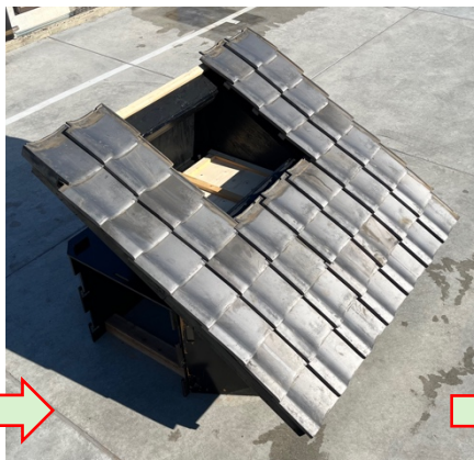
④ 栈木、屋根板、垂木、ルーフィングペーパーを破壊して開口