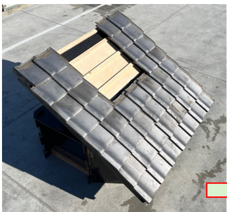
③ 進入部分の瓦を全て離脱