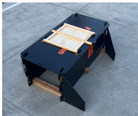
② 天井破壊用パーツを設置