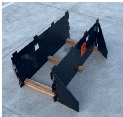
① PBS 天板を穴あき天板に交換