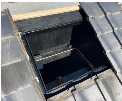
⑤ 天井を破壊して開口